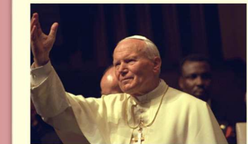
Saint Jean Paul II,