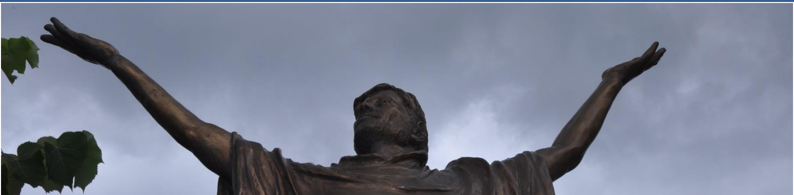
Statue de Saint-François à Assise