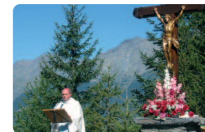
Célébration en plein air à Notre-Dame du Charmaix