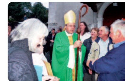
Fin d'une célébration dans l'ensemble paroissial de Notre-Dame des Belles Cimes