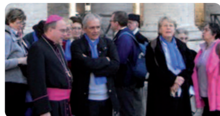
* Les 30 Savoyards présents avaient 47 ans de moyenne d'âge, beaucoup n'étaient pas nés au moment du Concile !

Un pèlerinage à Rome, là où le Concile s'est déroulé, a permis d'évoquer les moments-clés de ce rassemblement tandis que le rassemblement des diocèses de France à Lourdes, du 23 au 25 mars, a montré aux jeunes générations* toute la pertinence et l'actualité de Vatican II. Ce 50 e anniversaire a nourri la vie des communautés cette année... et pour longtemps !