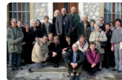
Rencontre avec les paroissiens de Novalaise