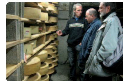
Visite de la ferme Cartier à Saint-Avre

Ces visites pastorales vont se poursuivre en 2012.